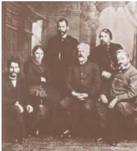
Tschaikowsky in trauter Runde mit Lehrkräften der Musikhochschule Tiflis im Jahre 1888.

Eine Ausführliche Beschreibung der Stücke findet Ihr unter www.orchester.waldorfschueler.de