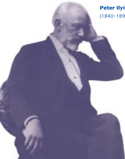
Peter Ilyich Tschaikowsky (1840-1893)