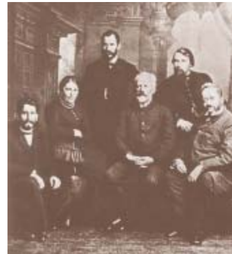
Tschaikowsky in trauter Runde mit Lehrkräften der Musikhochschule Tiflis im Jahre 1888.

Eine Ausführliche Beschreibung der Stücke findet Ihr unter www.orchester.waldorfschueler.de